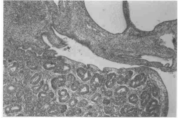
Şekil 2. Adenomatöz endometrial polipin uç kısmında karsinoma dönüşüm gösteren sitolojik ve arşitektürel atipi gösteren endometrial bezler (H&E, X80).